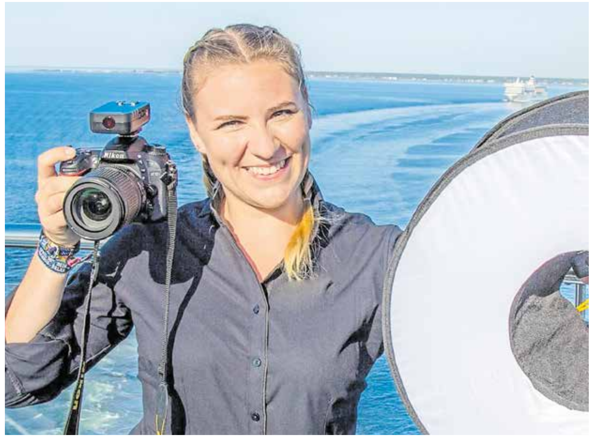
Die Fotografin Nadine Schaefer hat ihren Traumberuf gefunden.