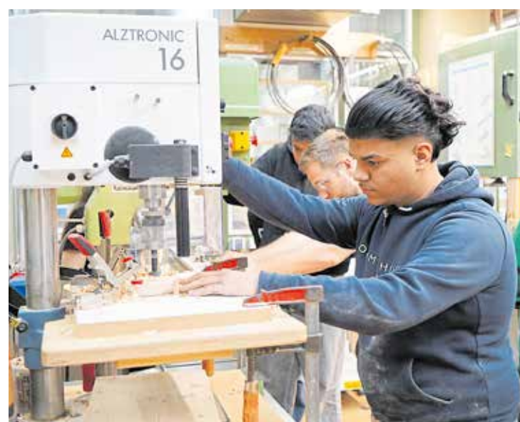
In der Holzwerkstatt lernten die Jugendlichen unter anderem das sichere Arbeiten an Holzbearbeitungsmaschinen.