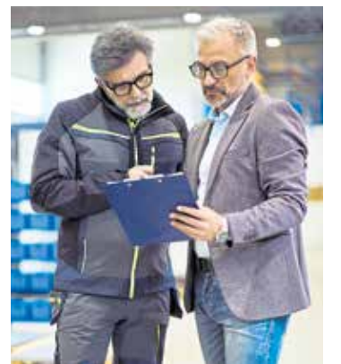
Vier erfolgreiche Projekte von Handwerkern und Wissenschaftlern werden ausgezeichnet.

Download unter www.hwk-reutlingen.de/zdh-praxis-recht_gewaehrleistung